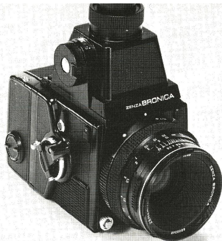
Zenza Bronica SQ 6x6 med lysmåler-skakten.

Et par detaljer ved SQ 6x6: der fås en prismesøger med et okular, som kan drejes fra »ligeud« (altså i skudretningen) til 30° skråt opefter. Der findes også en lodret skaktsøger. Begge har et okular, der kan indstilles, så man ikke behøver at bruge sine briller. Begge disse søgere har indbygget lysmåling gennem objektivet, med lysdiode i søgeren. En meget praktisk ting: hvert filmmagasin har sin egen ASA-indstillingsknap og den er via en række guldkontakter koblet med lysmåleren. Så hvis man f.eks. skiftevis bruger et magasin med en 125 ASA sort-hvid film og et andet magasin med en 400 ASA farvefilm, sker der ingen fejltagel-